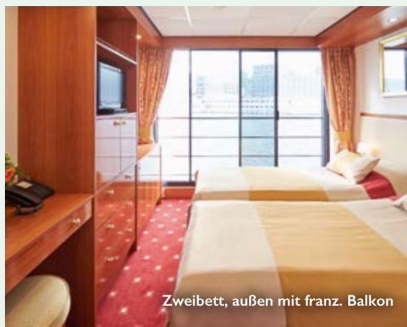
Zweibett, außen mit franz. Balkon